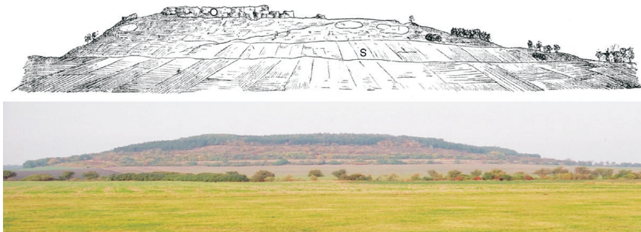
Obr. 1. Srovnání stavu odkrytosti Semické hůry koncem 19. století (nahore) a v současnosti (dole). Pohled od jihu od Starého Vestce. Horní obrázek podle FRIČE (1880). S – „semické slíny“ na pravém úbočí otevřené v jílovišti, O – opuky.

Sadské a další drobnější výchozy jsou vázány na území j. okraje mapy. Bylo zachyceno mnoha vrty po celém listu. Litologicky jde o monotónní šedé až žlutavě šedé prachovité slínovce až světle šedé vápnité prachovce. V některých případech lze ve spodní části souvrství vymezit až 6 m kompaktních vápnitých prachovců, které do nadloží přecházejí ve střípkovitě rozpadavé prachovité slínovce.