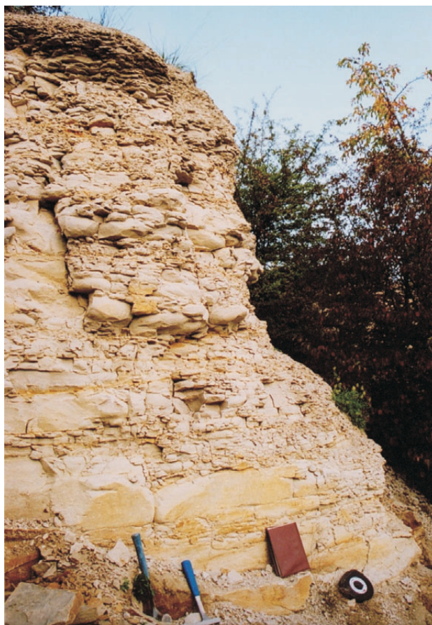
Obr. 2. Profil vyšší části jizerských hrubozrnných prachovců až velmi jemnozrnných vápnitých pískovců na temeni vrchu Sadská.

Jizerské souvrství (střední turon) je vyvinuto jako prachovité slínovce, vápnité prachovce s písčitou příměsí, jemnozrnné vápnité pískovce a písčité vápence. Stejně jako bělohorské souvrství byly i sedimenty jizerského souvrství zastíženy při většině vrtných prací prováděných