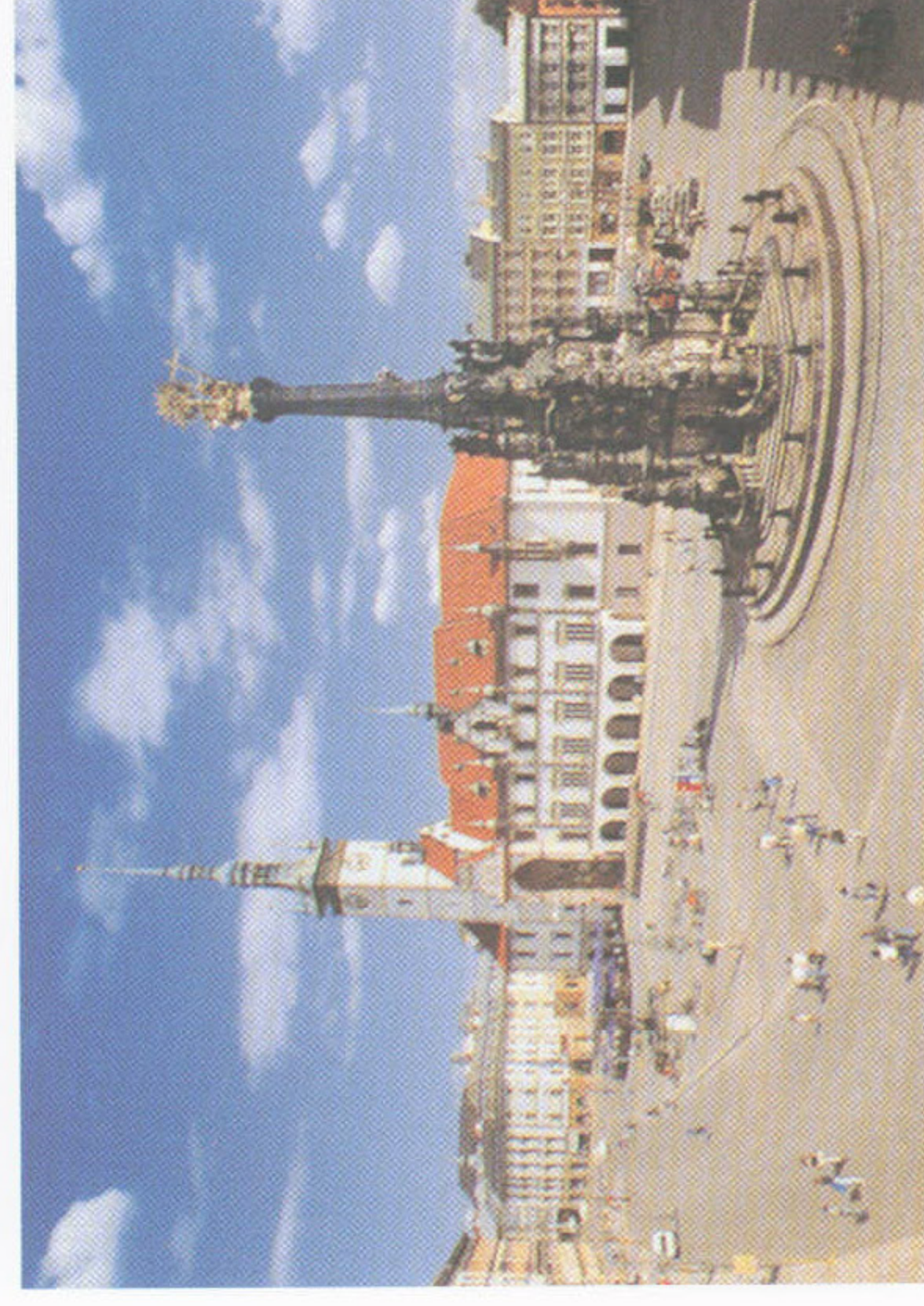
Sloup Nejsvětější Trojice v Olomouci z mladějovského a maletínského pískovce. K článku J. Šrámka na str. 158