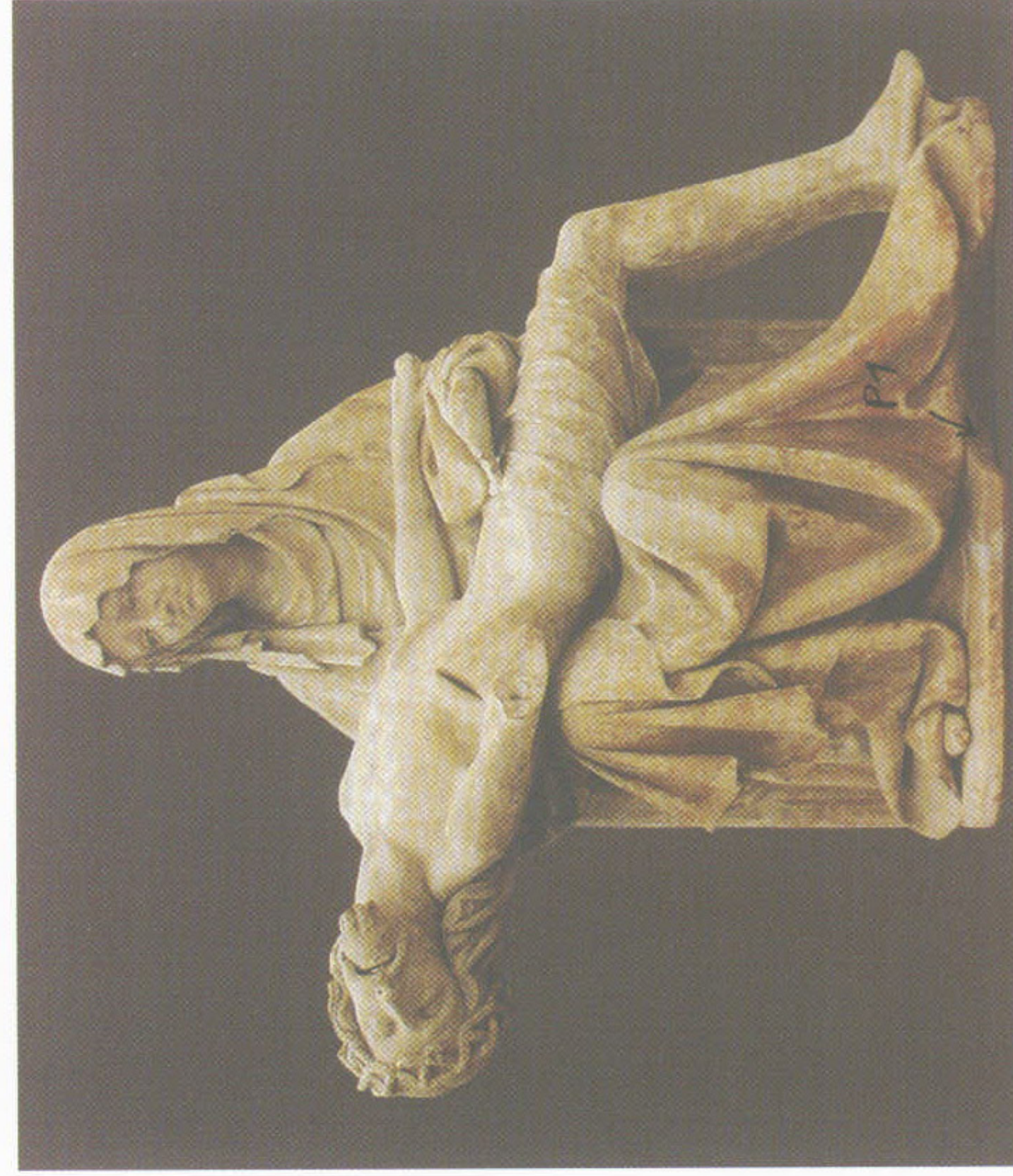
1. Pietta v magdeburské katedrále vytesaná z jednoho kusu kamene v parléřovské kamenické huti.