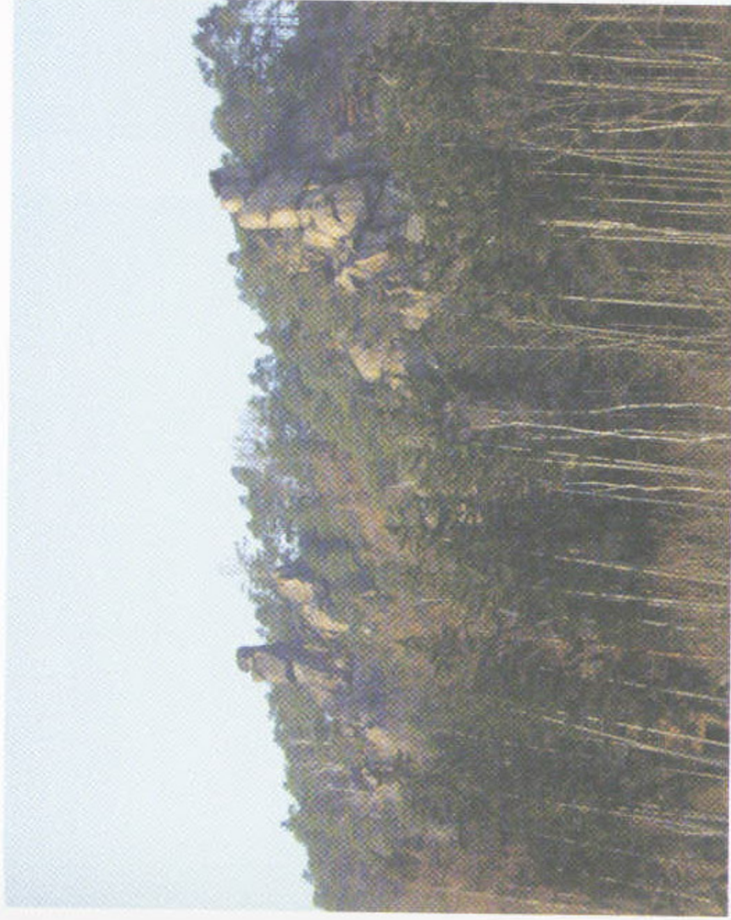
1. Skalní útvar „Kapucín“ s. od silnice Praha–Karlovy Vary. Skalní defilé tiského hrubozrnného biotického granitu je podmíněno výrazným vertikálním posunem sv. kry podél sz.-jv. zlomu.