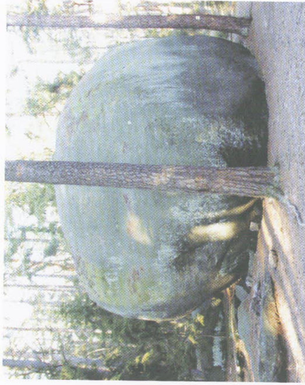
2. Skalní útvar „Dědek“ sz. od Žihle. Charakteristický tvar zvětvování hrubozrnného biotického granitu typu Tis. K článku K. Breitera na str. 13