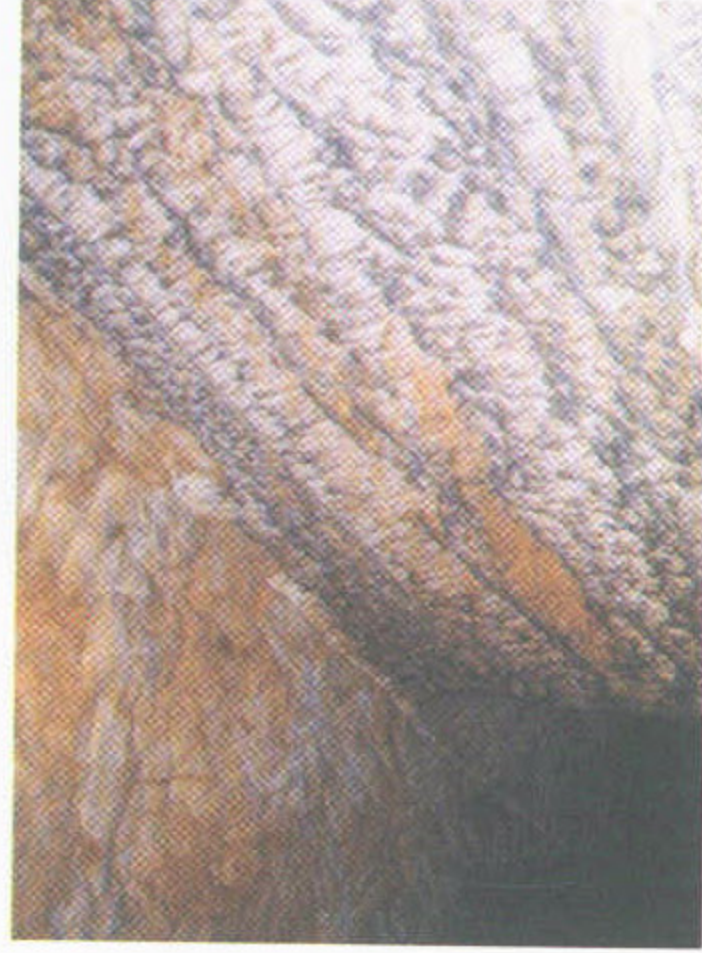
1. Voštiny na puklinové ploše rupertury směru SSV–JJZ v krytu Severka, Cvikov