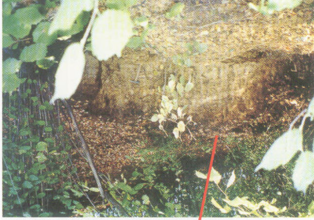
Skacany – umělý odkryv, 180 m od fary v zářezu úzké cesty vedoucí podél hřbitova (244 m n. m.)