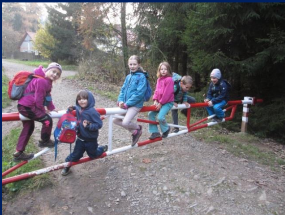
Na naše vesmírné putování jsme vyrazili raketou