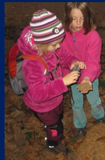
Na rudé planetě Marsu se nám líbilo nejvíce