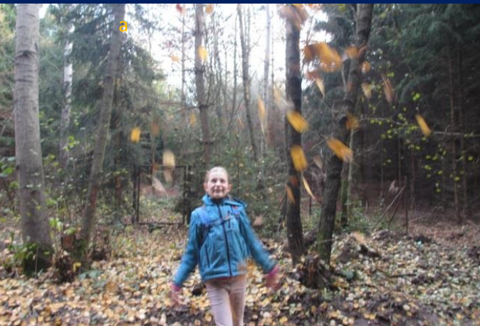
Přesto jsme občas zabloudili a ocitli se kdesi mezi hvězdami