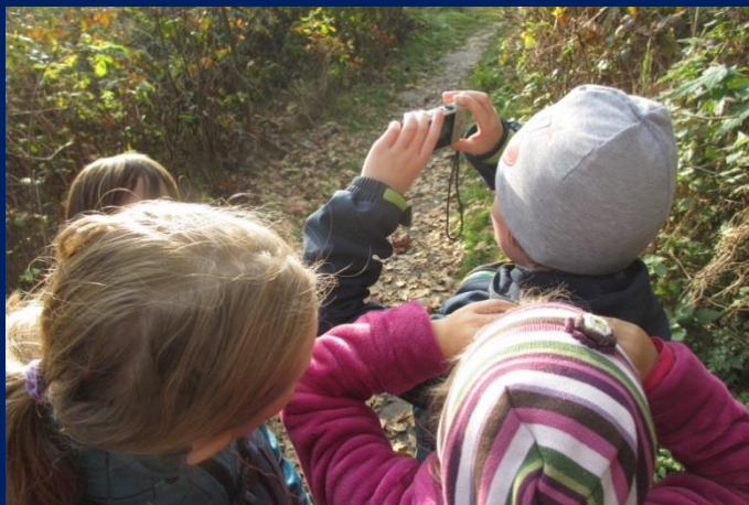
Prováděli jsme pečlivý záznam všeho, co jsme viděli