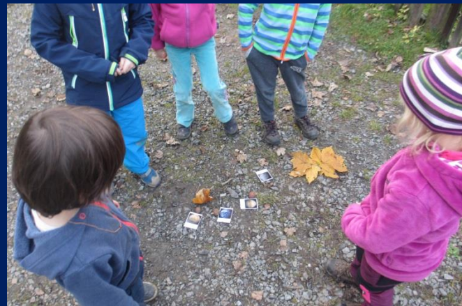
Naštěstí jsme měli s sebou mapu Sluneční soustavy